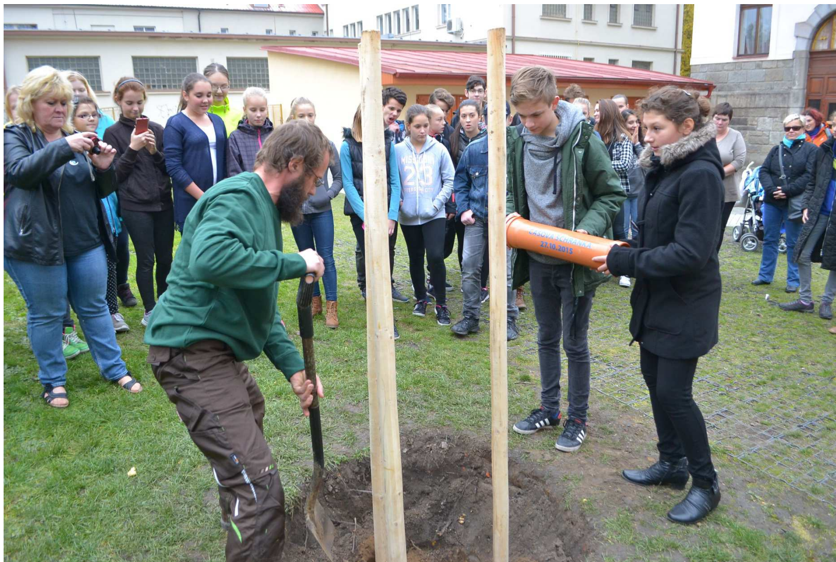
Fotografie z akce