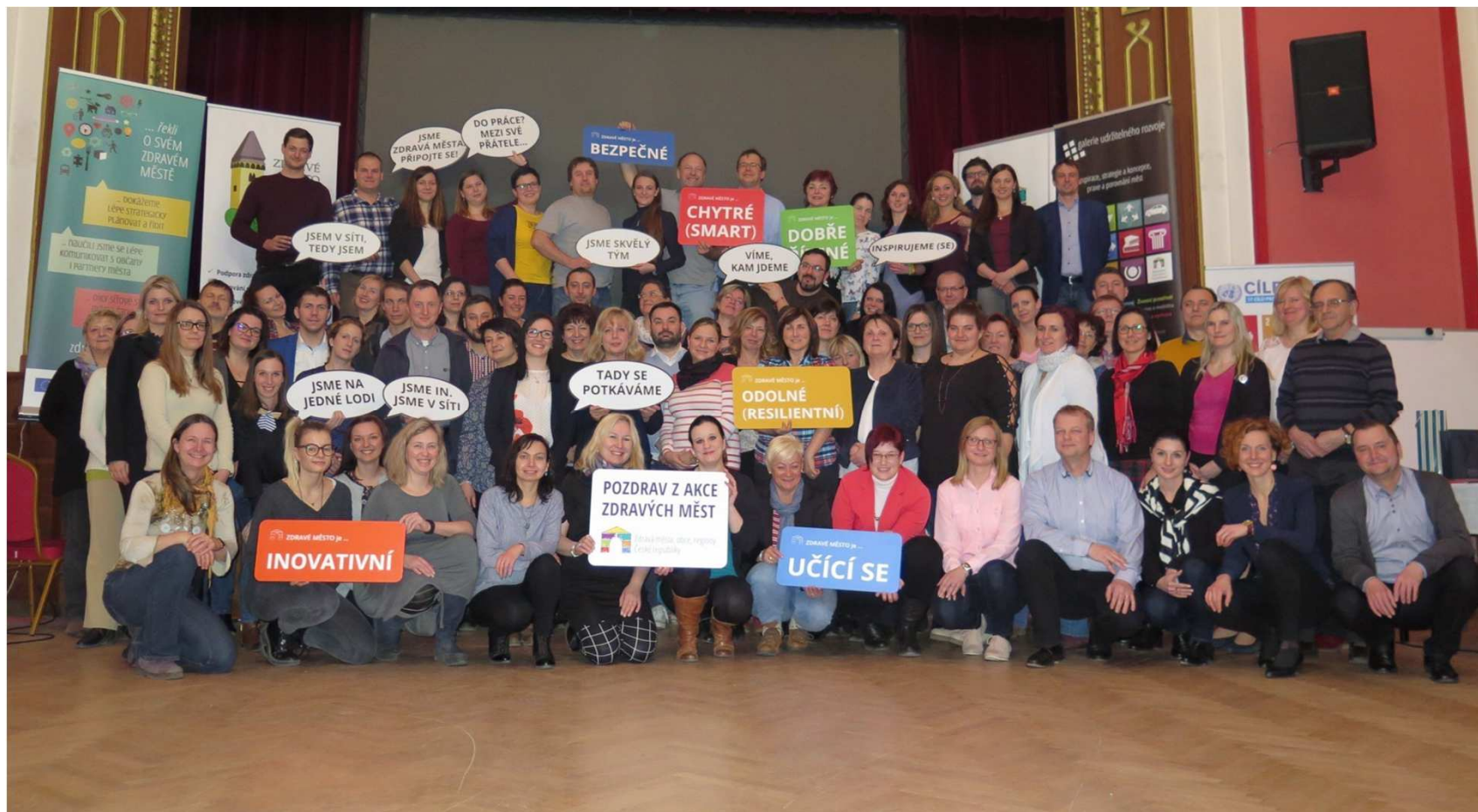
Závěrečné foto účastníků Jarní školy Zdravých měst